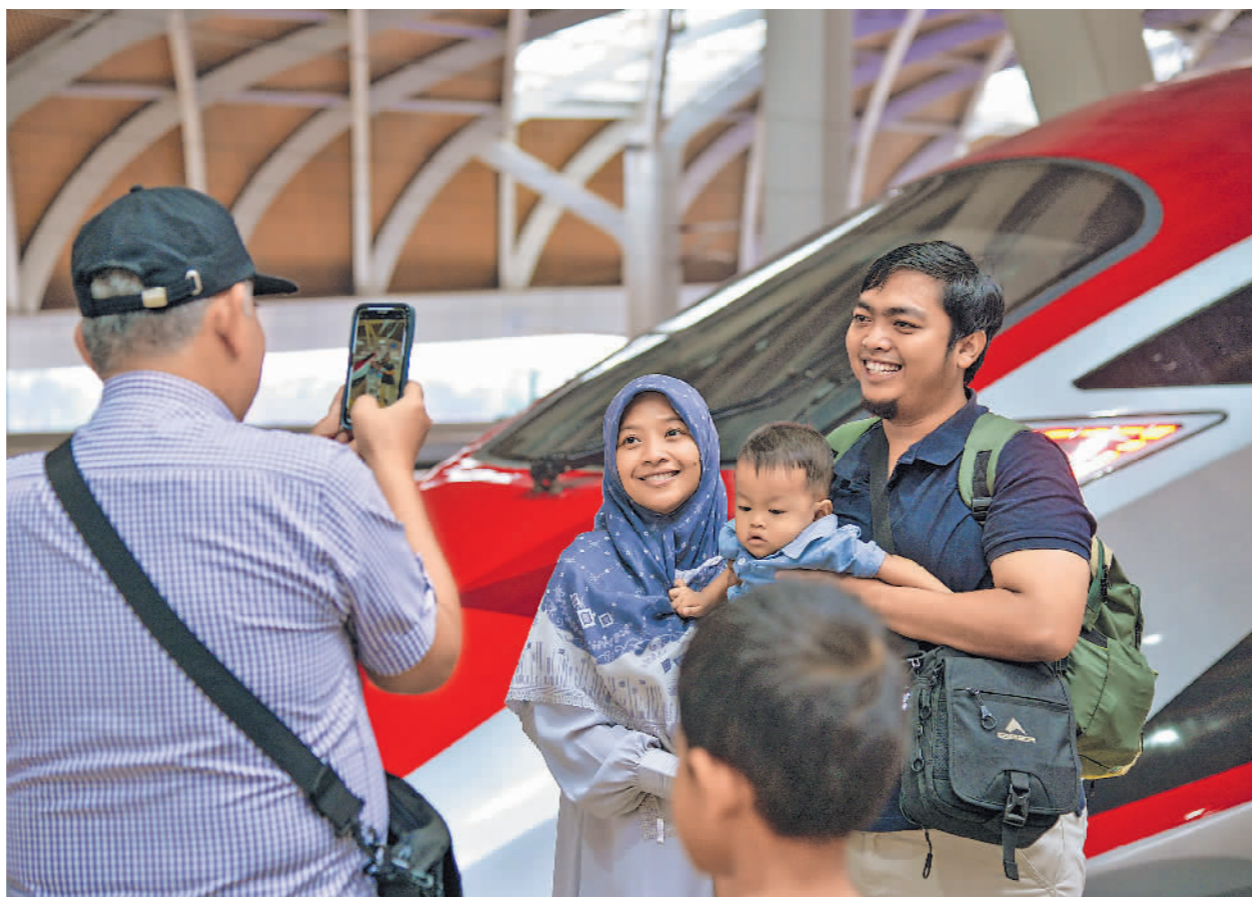
▲当地时间11月5日,在印度尼西亚雅加达哈利姆站,人们和雅万高铁高速动车组合影。 ▲当地时间11月5日,在印度尼西亚帕达拉朗站,人们到站下车。