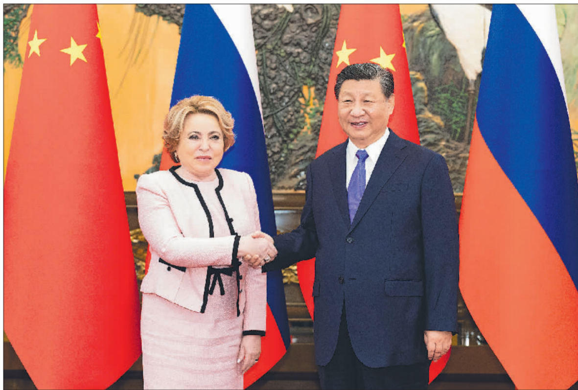
7月10日下午，国家主席习近平在北京人民大会堂会见俄罗斯联邦委员会主席马特维延科。